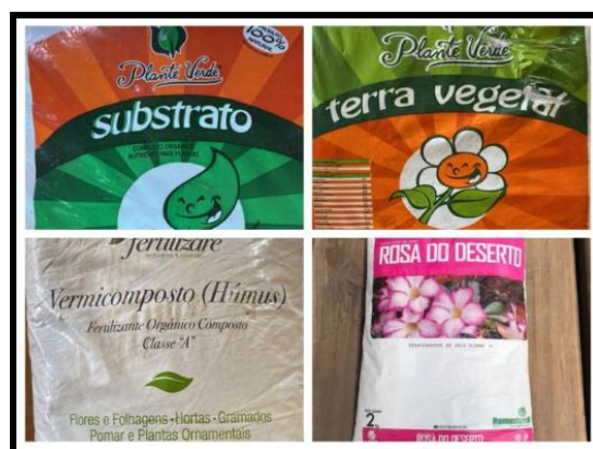
Figura 4 – Substratos utilizados no experimento.

Para o experimento foram utilizados copos descartáveis, para facilitar a visão das raízes, e quatro tipos diferentes de substratos: vaso 1 – terra vegetal para vasos, floreiras, hortas, gramados e jardins; vaso 2 – vermicomposto (húmus) – fertilizante orgânico composto – classe A, flores e folhagens, hortas, gramados, pomar e plantas ornamentais; vaso 3 – composto orgânico, com nutrientes, casca de pinus, casca de eucalipto, fibra de coco, palha de arroz e compostagem apresentou-se melhor para o desenvolvimento das mudas; vaso 4 – terra especial para Rosa-do-Deserto – condicionador de solo classe A (Figura 4).