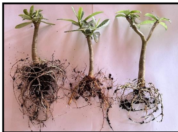
Figura 7 – Enraizamento das mudas da rosa-do-deserto

De acordo com o experimento efetuado com os quatro tipos de substrato, notou-se que todas as mudas desenvolveram, porém foi observado que o substrato 3 (três), que é um composto orgânico com nutrientes, casca de pinus, casca de eucalipto, fibra de coco, palha de arroz e compostagem apresentou-se melhor para o desenvolvimento das mudas, uma vez que notou-se o surgimento de uma grande quantidade de raízes e de um número significativo de folhas novas (Figura 7).