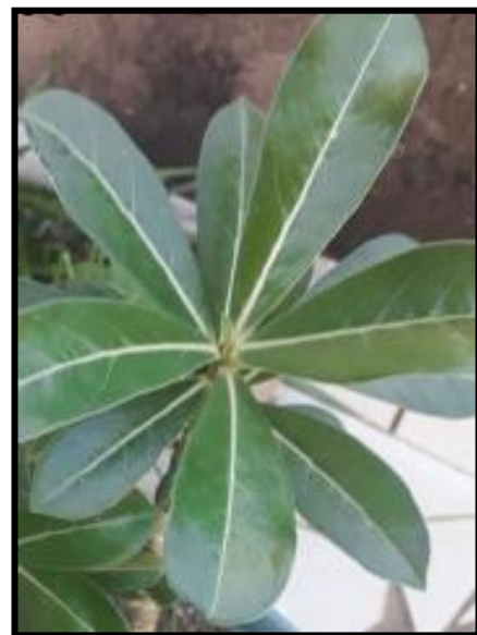
Figura 2 – Folhas da Rosa-do-Deserto.

As folhas apresentam coloração verde escura, algumas com aspecto brilhante (Figura 2), suas flores possuem forma tubular que possuem uma variedade de cores, que podem ter coloração branca até diversos tons de rosa. A produção de flores ocorre dentro de um ano (Mclaughlin; Garofalo, 2010).