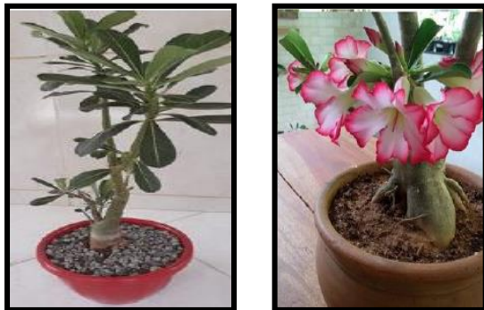
Figura 1 – Rosa-do-Deserto cultivadas.

Segundo Silveira (2016), a rosa-do-deserto é uma planta herbácea, suculenta, xerófila, arbustiva e ramificada (Figura 1), podendo atingir até quatro metros de altura e meio metro de largura de caule. Apresenta flores com forma tubular com ampla variação de cores, que vai da coloração branca a diversos tons de cor de rosa.