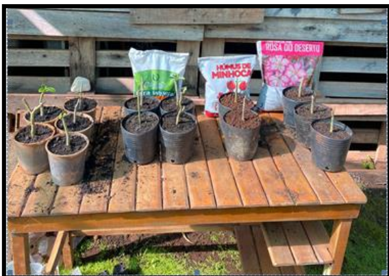
Figura 6 – Experimentos realizados.