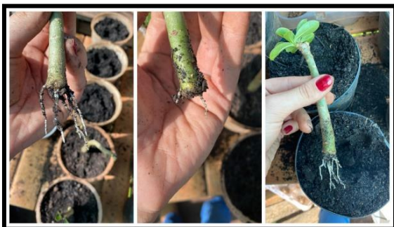
Figura 8 – Enraizamento das rosas-do-deserto.

Todas as mudas usadas no experimento enraizaram de maneira uniforme após 30 dias de transplantes. Os recipientes com as mudas foram mantidos em ambientes sombreados e a irrigação foi mínima, para evitar que apodrecimento das estacas (Figura 8).