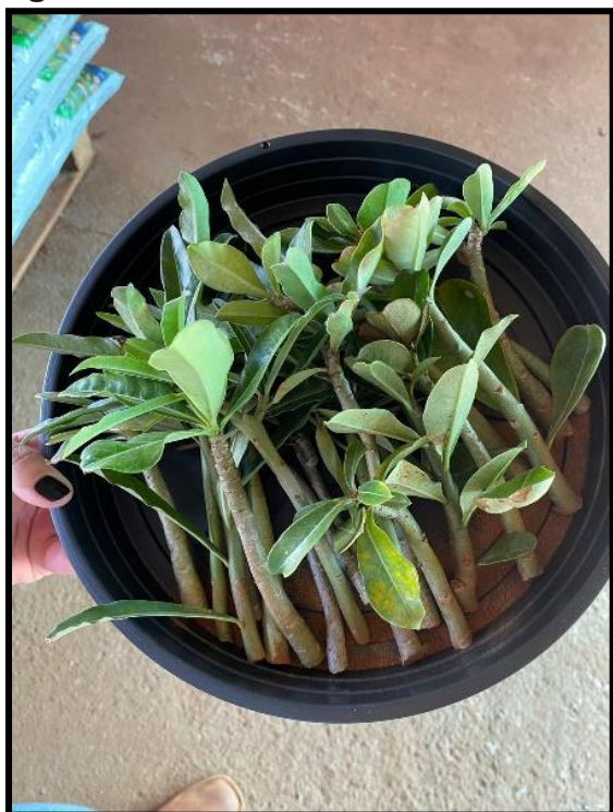
Figura 5 – Mudanças de rosa-do-deserto.

Iniciou-se o experimento passando canela nas mudas de Rosa-do-Deserto. As mudas foram feitas por meio de poda de outras plantas já adultas e manteve-as por 2 a 3 dias em local com sombra e com ventilação natural. (Figura 5).